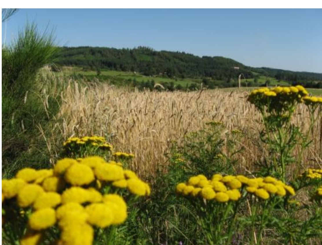
Site de proximité Monts du Forez