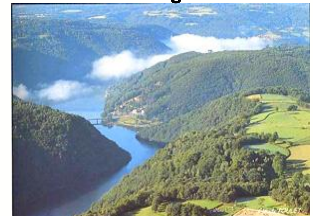
Pays des Combrailles