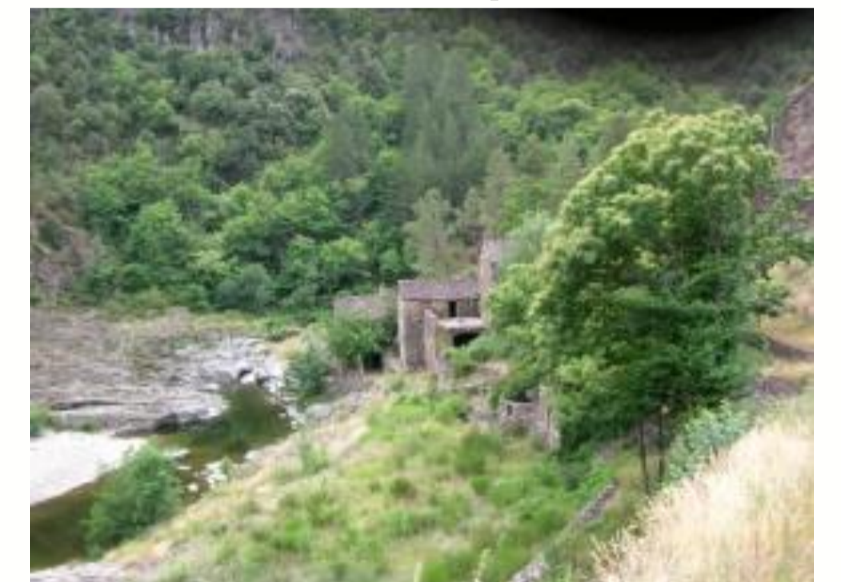
Parc Naturel Régional des Monts d'Ardèche