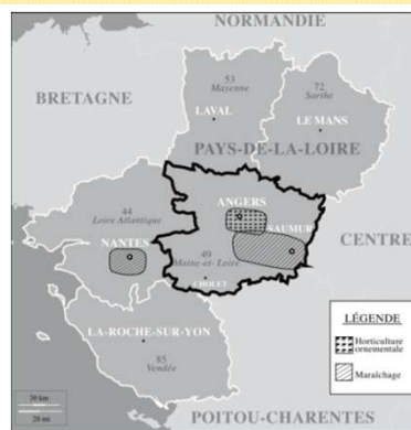
Figure n° 1 : Localisation des unités de production des filières horticulture et maraîchère en Pays-de-la-Loire

Nous prenons pour points de départ différents scénarii relatifs aux stratégies relationnelles privilégiées par ses membres : celles-ci se traduisent par leur tendance à choisir des partenaires particuliers selon qu'ils aient ou non collaboré dans le passé.