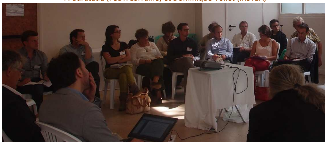
Parole aux acteurs et porteurs de projets